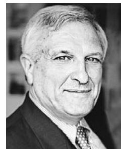
Josef Joffe ist Herausgeber der ZEIT

haben doch Union und FDP eine klare absolute Mehrheit von mindestens 21 Stimmen. Und wenn genug »Gurkentruppler« und »Wildsäue« abspringen? Es müssten schon 163 das Lager wechseln, um Rot-Grün im ersten Wahlgang den Sieg zu schenken. Im dritten, wo die relative Mehrheit wie 1969 und 1994 den Ausschlag gäbe? Die hätte Rot-Grün selbst mit Ganz-Rot nicht.