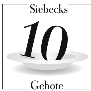
In der nächsten ZEIT: 6. Gebot – Du sollst nicht panschen

Da sich hier, wie so oft, eine Naturkatastrophe durch kleine Vorzeichen ankündigte, hätte ich uns in Sicherheit bringen müssen, als ich in der Fischsuppe die trockenen Leichen einiger Krevetten fand, die sich nicht rechtzeitig aus der heißen Brühe hatten retten können und an ausgekochte Zigaretten denken ließen. Aus Furcht vor einem Nachbeben flüchteten wir, so schnell wir konnten.