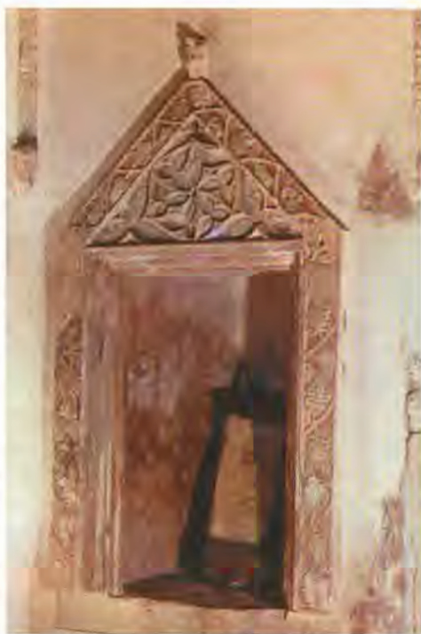
Toraschrein, Synagoge Ödenburg/Sopron, 14. Jahrhundert

Eine individuelle Möglichkeit der Repräsentation bot die liturgische Kleidung: Männer tragen in der Synagoge den Tallit oder Gebetsschal; Isserleins kleiner Gebetsschal ( Arba Knafot ) bestand aus Ar-