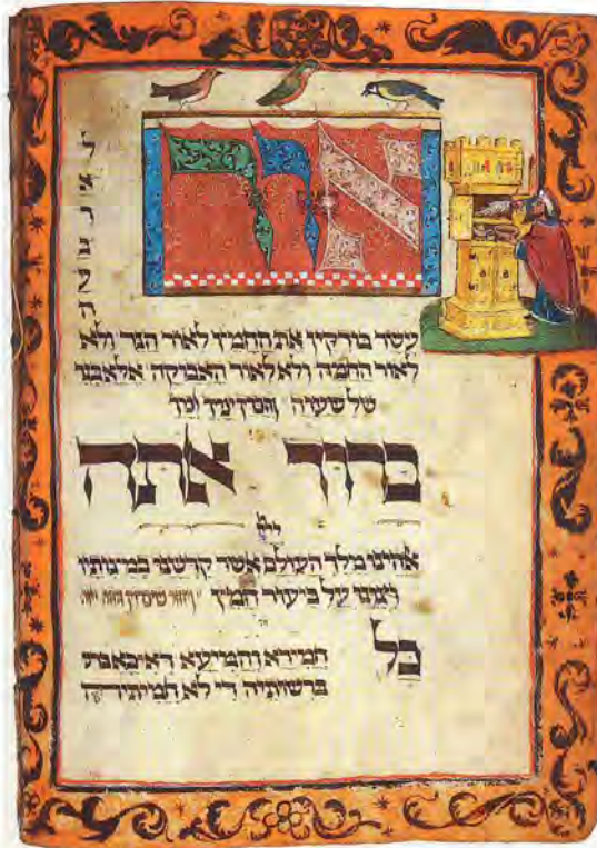
Entfernung der Krümel vor Pessach, Haggada aus Süddeutschland, um 1480/90

Um nur einige Beispiele aus den vielen herauszugreifen: Zu Pessach