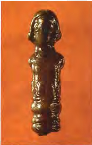
Schreibgriffel mit Darstellung eines Jünglings, Fundort: Judenplatz Wien

»[...] einer war in meinem Haus, er war es nicht wert, ihm zwei Pfennige zu geben, und ich gab ihm ungefähr zwei Gulden für seine Versorgung. Und das halbe Semester stahl er Wein, immer aus einem meiner Fässer, und dadurch verdarb dieser. Mitten in der Nacht, nach Mitternacht, öffnete er mein Gewölbe und stahl daraus Brot und Fleisch [...] Der Heilige, gepriesen sei Er, weiß, daß ich keineswegs gegen alle Bachurim , die bei mir lernen, eingestellt bin, nur manchmal lasten ihre Trinkgelage und ihre Streitereien, die sie mit den Hausbesitzern austragen und dergleichen, schwer