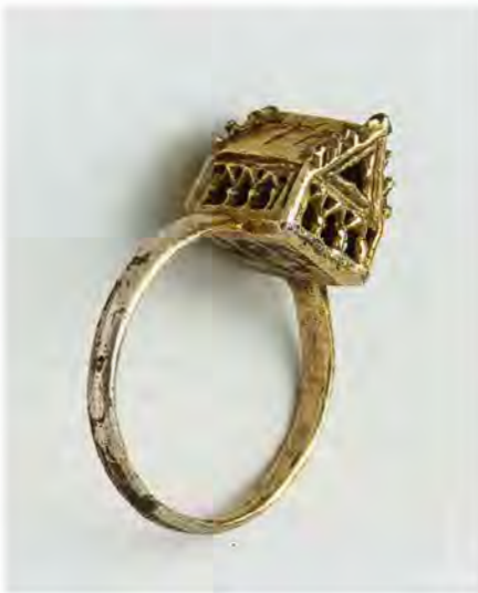
Hochzeitsring, Weißenfels, erste Hälfte 14. Jahrhundert

Beim Verlobungsmahl am Vorabend, bei dem die Verlobungsgeschenke ( Siblonot ) durch Rabbiner und Gemeindevorstände überreicht wurden, beim Mahl am Schabbat vor der Hochzeit, das mit den deutschen Ausdrücken vorspiel und spinholz bezeichnet wurde, und beim Hochzeitsmahl selbst spielten christliche Musiker auf. Bis jetzt sind christliche Gäste nur in Nürnberg und Zürich nachgewiesen, doch ist wohl in allen Gemeinden davon auszugehen. 454 Oberschichtfamilien bot das Hochzeitsfest die Möglichkeit, mit wertvollen Silbergürteln, Broschen, »Krenzel« aus Perlen und prächtigen Hochzeitsringen, oft mit gotischen Häuschen – einige Stücke sind noch erhalten –, Kleidung, Speisen, Musik und Unterhaltung die für Geschäftsanbahnung und Erfolg notwendige Repräsentation zu betreiben. 455