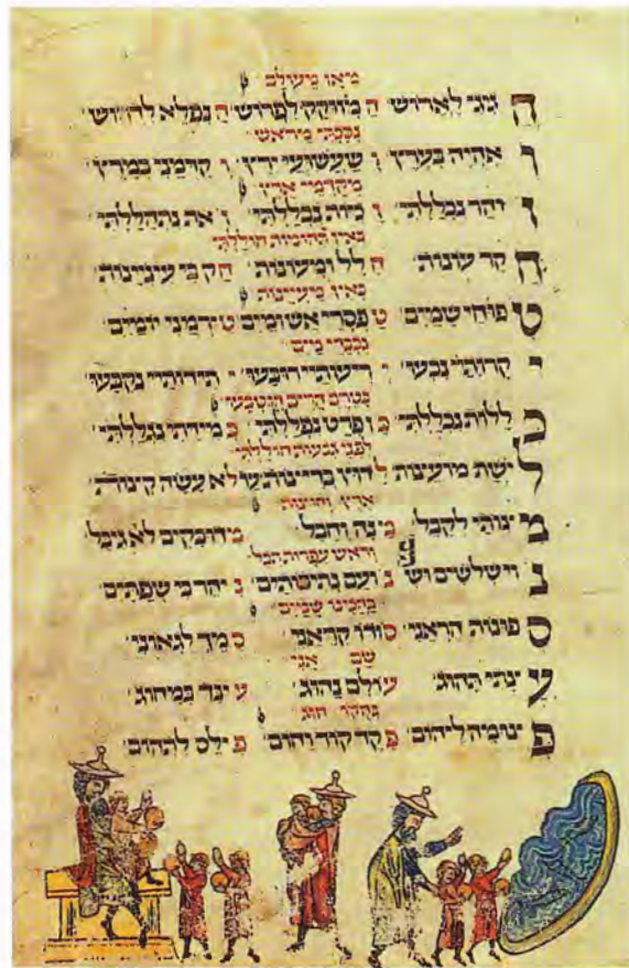
Ritual des ersten Lernens, Machsor Lipsiae , Südwestdeutschland um 1320

Die Kleinkindzeit wurde also bereits als Vorbereitung zu jener Lebensphase angesehen, in der der Knabe aus der mütterlichen Sphäre hinaus zum Unterricht beim Vater oder Lehrer in einer Gruppe von Gleichaltrigen gelangt. Diesen »Übergang« von Mutter zu Vater, Haus zu Schule – hebräisch: Bet Sefer , was jeden Raum, in dem Unterricht stattfand, bezeichnete –, vom Individuum zum Kollektivwesen und vom Ungebildeten zum Gelehrten brachte ein Ritual zum Ausdruck, das in mehreren Erziehungstraktaten des 12. und 13. Jahrhunderts überliefert ist. Über seine tatsächliche zeitliche und geographische Verbreitung ist allerdings kaum etwas be-