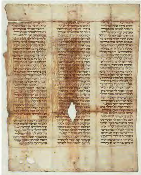
Esterfragment, Krems vor 1421

Ein Beispiel von vielen: Im Stadtmuseum Krems überlebte ein Fragment einer Esterrolle als innere Umschlagseite eines Zehentbuchs aus dem Jahr 1431, das nach Angaben von Leopold Moses die Verse Ester 8, 10 ff. enthält. 94 Es ist noch zu prüfen, jedoch überaus wahrscheinlich, daß es sich um das Fortsetzungsstück eines weiteren