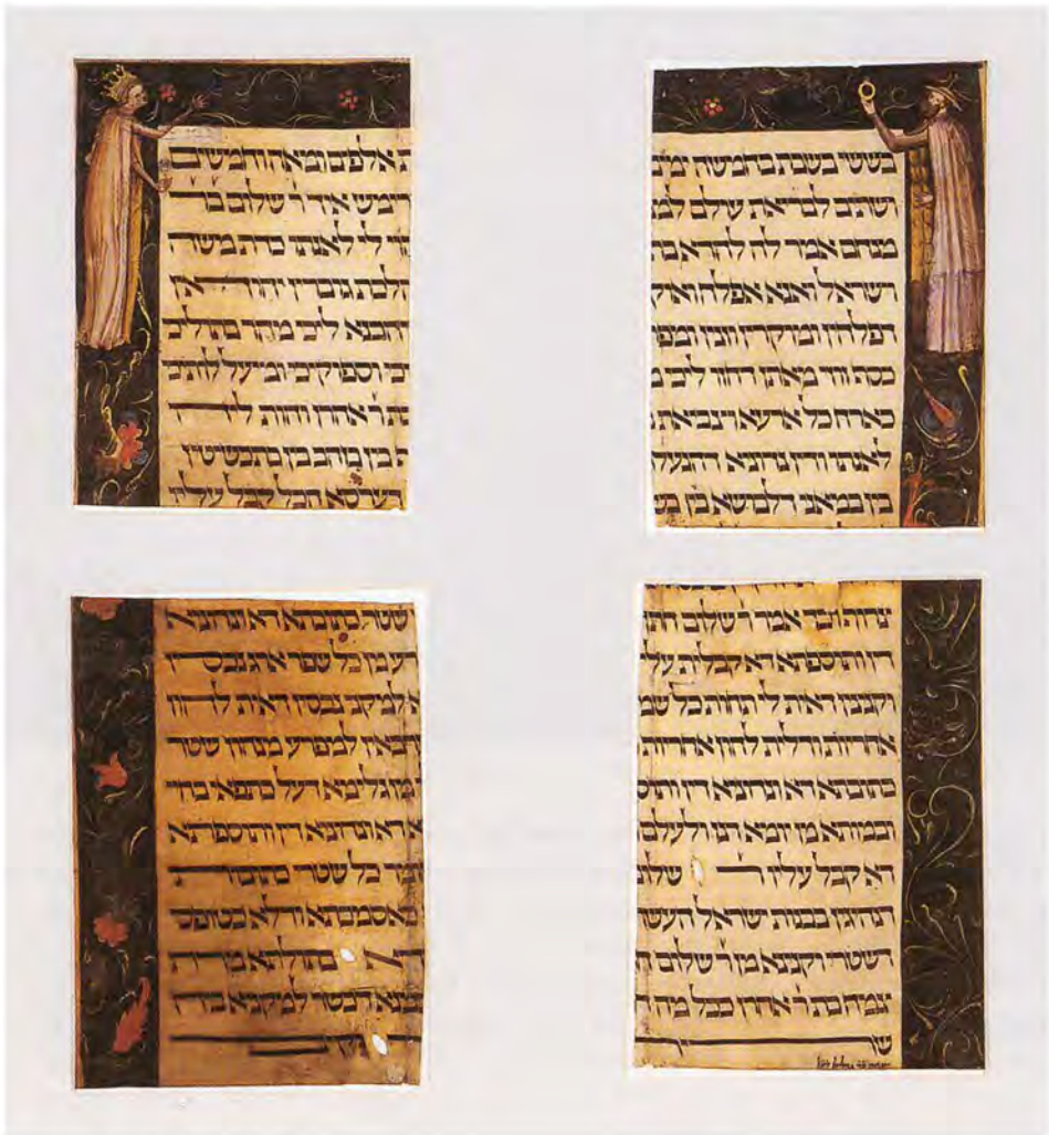
Kremser Ketubba, 1391/92

Hand eine Blume, die vermutlich die deutsche Übersetzung ihres Namens symbolisieren soll. Da kein zweites Ketubba-Exemplar dieser Art erhalten ist, kann die Gestaltung schwer in einen Kontext gestellt werden. Mit den etwa 30 noch erhaltenen spanischen Ketubbot hat die Kremser keine Gemeinsamkeit, manche von ihnen haben zwar verzierte Randleisten, aber keine ist in dieser Weise illuminiert. 96