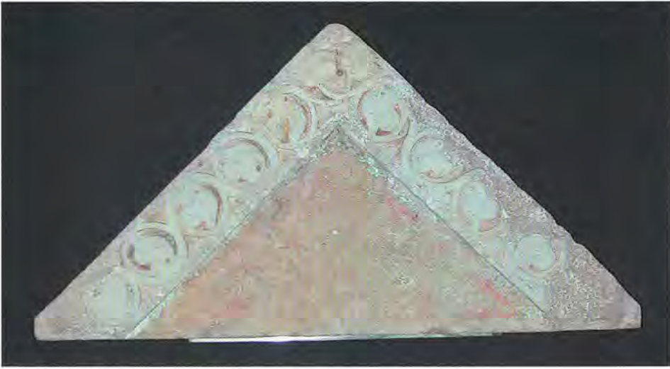
Vermuteter Giebel des Toraschreins der Synagoge Graz, vor 1450

Wiener Neustadt, Perchtoldsdorf, Linz, Neunkirchen, Graz, Judenburg, Hartberg, Murau, Friesach, Radkersburg, Voitsberg, Pettau/Ptuj, Salzburg, Hallein, Völkermarkt und Villach. Unsicher überliefert sind Synagogen in Hadersdorf am Kamp, Weiten, Bruck an der Mur und St. Veit an der Glan. 33