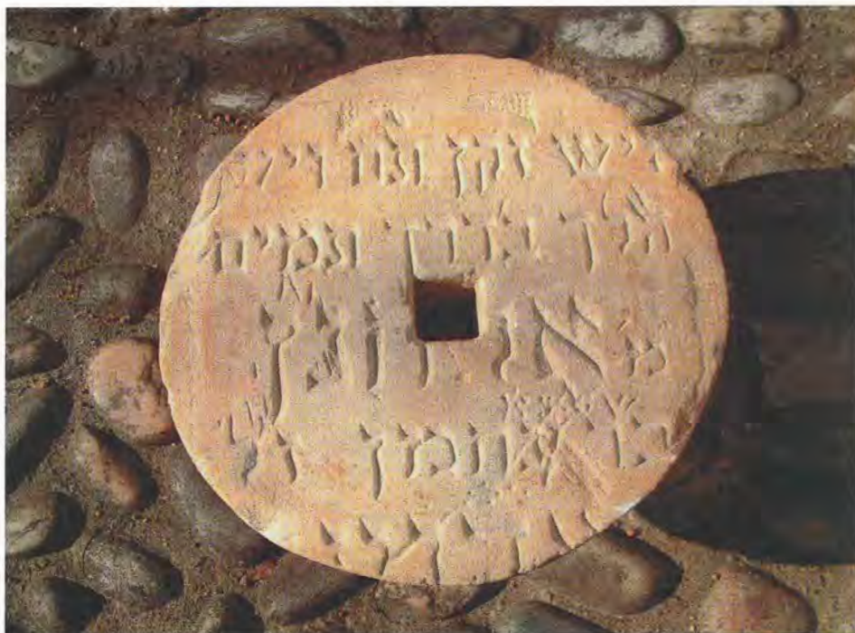
Grabstein des Elchanan, Sohn des Nachman (14. Jahrhundert), zu einem Schleifstein umgearbeitet

für Mordechai, Sohn des bedeutenden Geldleihers Abrech, vom 11. Dezember 1360, heute im Stadtmuseum Friesach, und ein zu einem Schleifstein umgearbeiteter für Elchanan, Sohn des Nachman, dessen Jahreszahl durch die Rundbearbeitung nicht mehr erhalten ist. Er wurde 1976 in einer Bachrunse bei Pogöriach nahe Judendorf bei Villach, wo der mittelalterliche jüdische Friedhof gelegen hatte, aufgefunden und befindet sich seit 1991 im Stadtmuseum Villach. 47