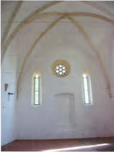
Rekonstruierte Synagoge in Marburg/Maribor, Innenraum, 15. Jahrhundert

14. Jahrhundert errichtet. Die Einwölbung des einfachen Saalbaus erfolgte im ersten Viertel des 15. Jahrhunderts, also in der Blütezeit der Marburger Gemeinde, zu Lebzeiten des Rabbiners Israel Isserlein. 1477 soll ein Marburger Jude »zum paw der judenschul« beigetragen haben, was aber auch einen Aus- oder Befestigungsbau meinen kann. 27 Die Ostwand ist durch ein zentrales Rosettenfenster und zwei schmale gotische Lanzettenfenster gegliedert, ein doppeltes Lanzettenfenster befindet sich auch an der Westwand. Das Hauptportal, umgeben von zwei zarten Säulen, liegt in der südlichen Ecke der Westwand, also in unüblicher Lage. Die Nordseite konnte aufgrund der Umbauten nicht mehr rekonstruiert werden. 1497, nach der Vertreibung der steirischen Juden, kaufte das Bürgerehepaar Druckner das Gebäude