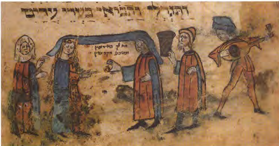
Trauwingszeremonie, Süddeutschland um 1460/70

In enger Auseinandersetzung mit der christlichen Umwelt stand die strukturelle Neu-