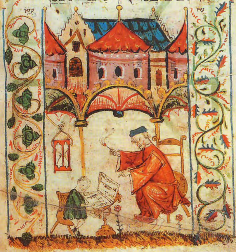
Lehrer und Schüler, Coburger Pentateuch 1395