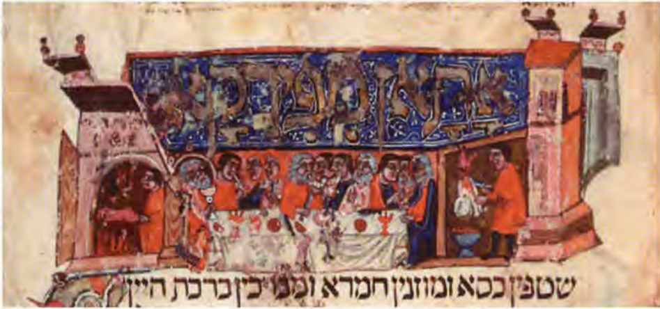
Pessachmahl, Barcelona Haggada, zweite Hälfte 14. Jahrhundert