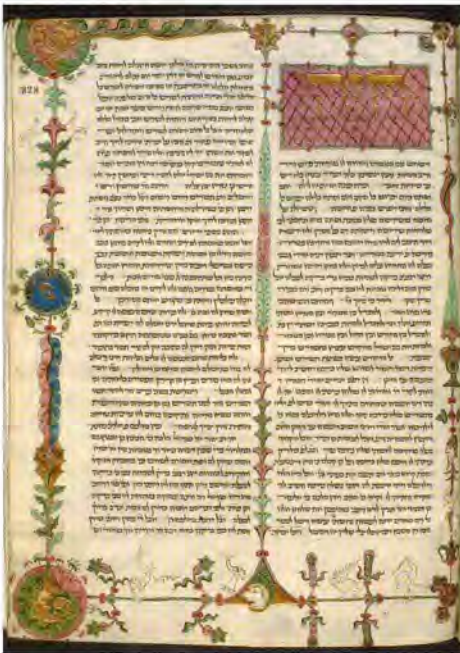
»Niederösterreichischer Randleistenstil«: Sefer Mordechai, Niederösterreich 1371/72

Das »Buch Mordechai«, eine Sammlung von Responsen zahlreicher rabbinischer Autoritäten des 13. Jahrhunderts, war im 15. Jahrhundert noch in zwei Fassungen erhalten, einer rheinländischen ( Mordechai Bne Reinus ) und einer österreichischen ( Mordechai Bne Austraiich ). Der Verfasser Mordechai bar Hillel war ein Schüler von Rabbi Meir von Rothenburg (ca. 1220–1293) und wurde 1298 bei den Rindfleisch-Pogromen in Nürnberg getötet. 62 Die beiden Varianten unterscheiden sich in Umfang und Inhalt,