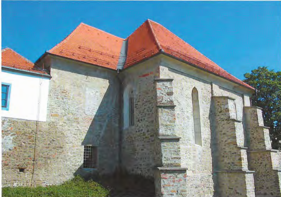
Rekonstruierte Synagoge in Marburg/Maribor, Außenansicht vom Draufufer

14. Jahrhundert errichtet. Die Einwölbung des einfachen Saalbaus erfolgte im ersten Viertel des 15. Jahrhunderts, also in der Blütezeit der Marburger Gemeinde, zu Lebzeiten des Rabbiners Israel Isserlein. 1477 soll ein Marburger Jude »zum paw der judenschul« beigetragen haben, was aber auch einen Aus- oder Befestigungsbau meinen kann. 27 Die Ostwand ist durch ein zentrales Rosettenfenster und zwei schmale gotische Lanzettenfenster gegliedert, ein doppeltes Lanzettenfenster befindet sich auch an der Westwand. Das Hauptportal, umgeben von zwei zarten Säulen, liegt in der südlichen Ecke der Westwand, also in unüblicher Lage. Die Nordseite konnte aufgrund der Umbauten nicht mehr rekonstruiert werden. 1497, nach der Vertreibung der steirischen Juden, kaufte das Bürgerehepaar Druckner das Gebäude