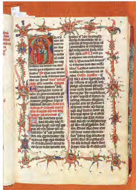
»Niederösterreichischer Randleistenstil«: Klosterneuburger Missale, zweite Hälfte 14. Jahrhundert