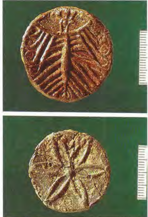
Token aus Blei, vor 1421, Fundort: Judenplatz Wien

In manchen Gemeinden der Frühen Neuzeit, frühestens ab 1555 im Ghetto von Rom, wurde der gemeindeinterne Zahlungsverkehr, also auch die Leistungen der Zedaka, in einer eigenen Währung abgewickelt. Ob der für Österreich einmalige Fund von neun bleiernen »Token« bei den Ausgrabungen am Wiener Judenplatz ebenfalls mit der Gemeindeorganisation zusammenhängt und diese vielleicht als interne Tauschwährung für die diversen Einrichtungen wie Schlachthof, Bäcker, Zedaka etc. gebraucht wurden, ist nicht zu klären; dies wäre der früheste Fall eines internen Geldverkehrs in einer Judenstadt. Jedenfalls stellen diese übergroßen Münzen mit Münzbildern wie König, Hirsch, Adler, Hund, Rad und Blume, aber ohne jede Inschrift und Wertangabe, eine »numismatische Sensation« dar. 121