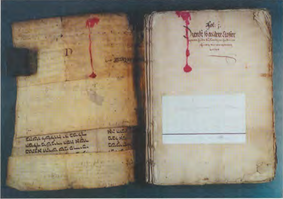
Als Einband verwendetes Esterfragment, Krems vor 1421

Fragments aus dem Niederösterreichischen Landesarchiv handelt, das vom Grundbuch des Eisentürhofs aus dem Gerichtsbezirk Krems aus den Jahren 1534 bis 1547 abgelöst wurde. Es ist in drei Spalten beschrieben, der Text beginnt rechts oben mit dem Ende des Verses Ester 5, 14 und endet links unten mit Ester 8, 2. Am oberen und unteren Ende sind Spuren einer Naht zu sehen; vielleicht war die Rolle mit einer Borte eingefaßt. Die sieben fehlenden Zeilen bis zum Beginn des Grundbucheinbands könnten durch das Zerschneiden verlorengegangen sein. 95